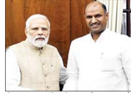
तीन दशक पहले की बात है। भाजपा के निवर्तमान प्रदेश अध्यक्ष पुनिया जाट हैं। हालांकि इस समुदाय की संख्या ब्राह्मणों से काफी अधिक है, लेकिन राजस्थान में इसका कभी कोई मुख्यमंत्री नहीं रहा है। भरतेंगे राजस्थान भाजपा की शूर्यता वर्तमान में जब ब्राह्मण प्रतिनिधित्व की बात आती है तो राजस्थान भाजपा में एक शून्य कमी कोई मुख्यमंत्री नहीं रहा है। भरतेंगे राजस्थान भाजपा की शूर्यता वर्तमान में जब ब्राह्मण प्रतिनिधित्व की बात आती है तो राजस्थान भाजपा में एक शून्य कमी कोई मुख्यमंत्री नहीं रहा है।

बनने से पहले राजस्थान भारतीय जनता युवा मोर्चा समेत कई पदों पर रहे हैं। 2014 में देश भर में चलने वाली नरेंद्र मोदी लहर में जोशी चित्तौड़गढ़ से लोकसभा के लिए चुने गए। उन्होंने 3.16 लाख वोटों के भारी अंतर से विजय हासिल की। 2019 में उन्होंने फिर से जीत हासिल की और वो भी पिछले से भी बड़ी जीत। कांग्रेस के प्रतिद्वंद्वी गोपाल सिंह शेखावत पर अपना अंतर बढ़ाकर 5.76 लाख वोट कर दिया। यह उस चुनाव में राज्य में दूसरी सबसे बड़ी जीत का अंतर था, इसके बाद बीजेपी के सुभाष चंद्र बहिरिया ने भीलवाड़ा से 6.12 लाख वोटों से जीत हासिल की। जोशी अगस्त 2020 से भाजपा के प्रदेश उपाध्यक्ष रहे हैं। चुनावी वर्ष में भाजपा एक ब्राह्मण नेता के रूप में जोशी को चुनने की कोशिश कर सकती है। राजस्थान में एक समुदाय से सबसे अधिक यानी चार ब्राह्मण मुख्यमंत्री रह चुके हैं। हालांकि ये आखिरी