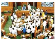
हमलावर रहा और भाजपा सांसद राहुल गांधी से माफो मांगते रहे। दूसरी ओर विपक्ष जबरदस्त तरीके से अदानी मामले को लेकर जेपीसी की मांग पर अड़ा रहा। इसके बाद शान छह बजकर करीब 10 मिनट पर ध्वनिमत से मंजूरी दी। वहीं, राहुल गांधी के मुद्दे को लेकर सत्तापक्ष लगातार विपक्ष पर

नई दिल्ली। दोनों सदन में आज भी जबरदस्त तरीके से हंगामा देखने को मिला। हंगामे को चबड़ से राज्यसभा की बैठक एक बार के स्थान के बाद दोपहर 2:00 बजे के करीब ही स्थगित कर दी गई थी। हालांकि, लोकसभा की कार्यवाही शाम 6:00 बजे शुरू की गई। लोकसभा में हंगामे के बीच वर्ष 2023-24 के लिए विभिन्न मंत्रालयों और विभागों से जुड़ी अनुदान की मांगों और संबंधित विनियोग विधेयक को बिना चर्चा के ध्वनिमत से मंजूरी दी। वहीं, राहुल गांधी के मुद्दे को लेकर सत्तापक्ष लगातार विपक्ष पर