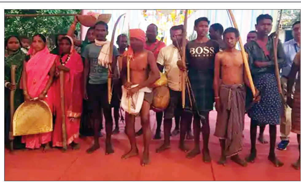
धमतरी में पोलिंग बूथ पर आदिवासी मतदाता तौर-धनुष लेकर वोटिंग के लिए पहुंचे।

शब्द नहीं हैं बल्कि जमीनी हकीकत हैं। 'वोकल फॉर लोकल' अभियान को लोगों का समर्थन मिला है। साथ ही उन्होंने कहा कि गत एक सप्ताह में लगभग 4.5 लाख करोड़ रुपये का कारोबार हुआ है, जिसमें दिवाली और छठ से संबंधित खरीददारी शामिल है। मोदी ने कहा कि कोविड-19 महामारी के दौरान भारत की उपलब्धियों ने लोगों में विश्वास पैदा किया कि देश अब रुकने वाला नहीं है। उन्होंने कहा कि लगभग 130 देशों ने भारत द्वारा आयोजित एक 'ग्लोबल साइथ शिखर सम्मेलन' में भाग लिया।