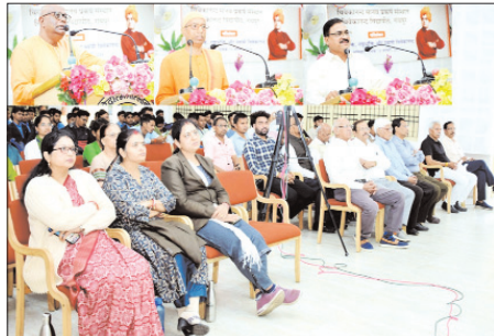
रायपुर। विवेकानन्द मानव संस्थान, विवेकानन्द विद्यापीठ, रायपुर द्वारा राष्ट्रीय युवा दिवस के उपलक्ष्य में 'युवाशक्ति, राष्ट्रभक्ति और स्वामी विवेकानन्द' विषय पर परिसंवाद का आयोजन किया गया।