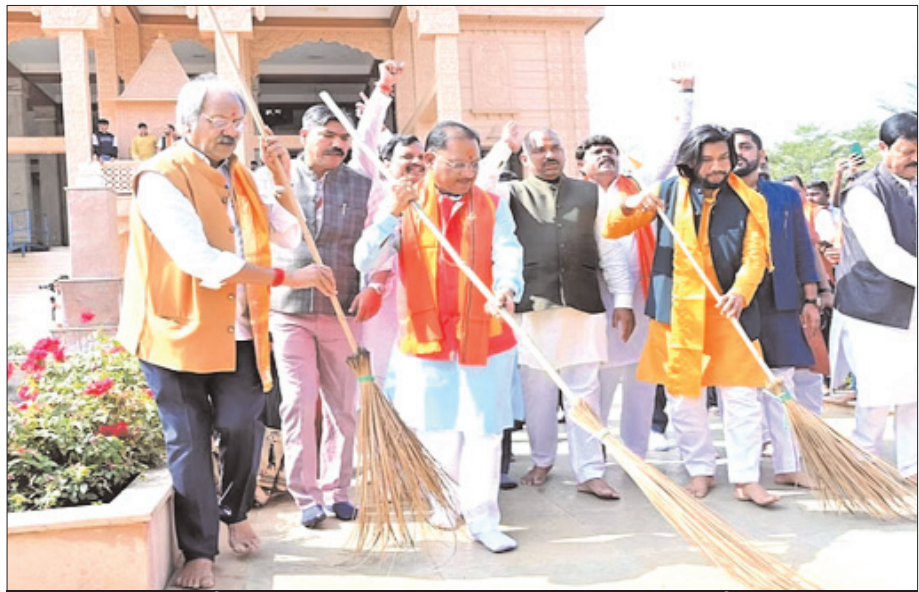
श्री राम मंदिर में झाड़ू लगाकर स्वच्छता अभियान में शामिल हुए

रायपुर। मुख्यमंत्री विष्णु देव साय रविवार को मकर संक्रांति के पावन अवसर पर नवा रायपुर अटल नगर स्थित पुरखौती मुक्तगंगन में संस्कृति विभाग द्वारा आयोजित 'पतंग उत्सव' में शामिल हुए। उन्होंने प्रदेशवासियों को मकर संक्रांति, पोंगल, गुड़ीपड़वा और लोहड़ी की शुभकामनाएं