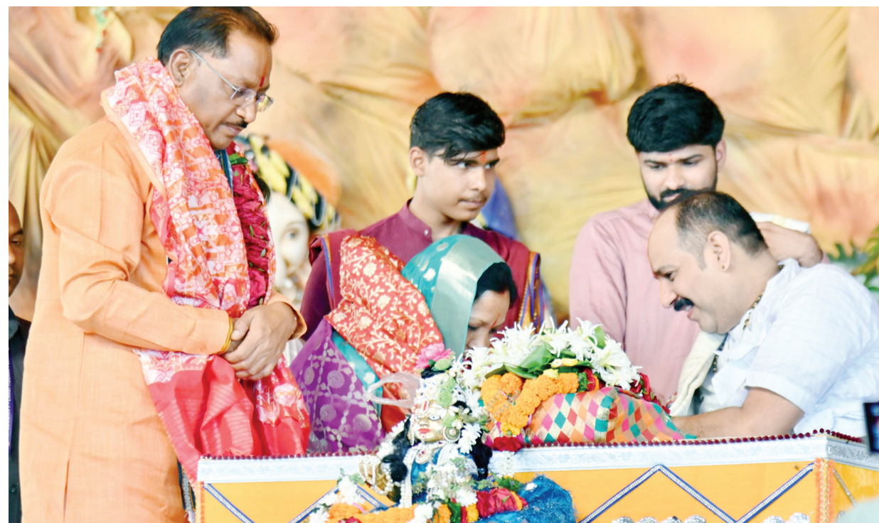
कुरुद में आयोजित शिव महापुराण कथा में मुख्यमंत्री विष्णु देव साय सपरिवार हुए शामिल। कथावाचक महाराज प्रदीप मिश्रा का लिया आशीर्वाद, की सबके कल्याण की कामना।

से 12 तक के छात्रों के लिए गर्मी की छुट्टियों की घोषणा की है। राजस्थान, हरियाणा, चंडीगढ़ और उत्तर प्रदेश के बड़े हिस्सों में तापमान 45 डिग्री सेल्सियस से ऊपर रहा, जिससे दैनिक जीवन प्रभावित हुआ और कई लोगों ने दोपहर में घर के अंदर ही रहना पसंद किया। मध्य प्रदेश में, रतलाम और नौगोंग में अधिकतम तापमान 45.5 डिग्री सेल्सियस दर्ज किया गया, इसके बाद दतिया में 45.2 डिग्री, खजुराहो में 44.8 डिग्री और ग्वालियर में 44.7 डिग्री दर्ज किया गया। इससे पहले, मौसम विभाग ने भारत में अप्रैल-जून की अवधि के दौरान अत्यधिक गर्मी की चेतावनी दी थी, जो कि 1 जून को समाप्त होने वाले सात चरण के लोकसभा चुनावों के साथ मेल खाएगा।