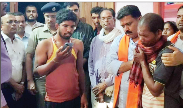
बाहपानी के पास सड़क दुर्घटना में 19 लोगों आकस्मिक निधन दुःख, इस दुख की घड़ी में हर संभव मदद होगी- विजय शर्मा

कवर्धा/ रायपुर। कवर्धा में कुकदूर थाना क्षेत्र में घटित सड़क दुर्घटना ने पूरे देश को झकझोर दिया है। आज छत्तीसगढ़ के वनमंत्री केदार कश्यप ग्राम सेमरहा पहुँचकर पीड़ित परिवारों से भेंट करिये केंदार कश्यप ने सड़क दुर्घटना को लेकर कहा की यह बहुत ही हृदय विदारक घटना है और निश्चित तौर पर जो क्षति हुई है। उस क्षति को कोई पूरा नहीं कर सकता। उन्होंने कहा कि यहाँ सभी हमारे आदिवासी समाज के भाई बहन हैं। हम यहाँ पर मंत्री होने के नाते नहीं बल्कि सामाजिक होने के नाते हम उपस्थित हुए हैं। यहाँ हमारे समाज के सभी लोग उपस्थित हैं और हमारे यहाँ के विधायक जी भी यहाँ पर उपस्थित हैं। उन्होंने कहा हमारी कोशिश रहेगी की सरकार की जितनी भी योजनाएँ हैं उन योजनाओं का लाभ इनको दिया जाए और उनके परिवार के आर्थिक