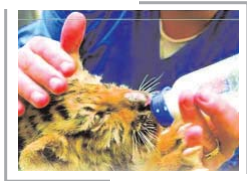
पेज-6» वेहद अलग हे जुलूजी में कॅरियर