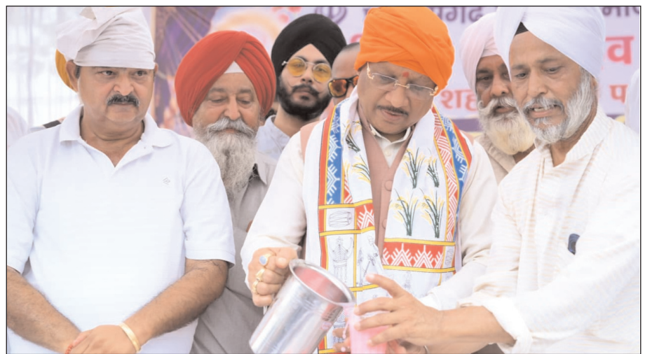
रायपुर। मुख्यमंत्री विष्णुदेव साय ने आज श्री गुरु अर्जुन देव जी के शहीदी दिवस के अवसर पर राजधानी रायपुर के तेलीबांधा स्थित गुरुद्वारा परिसर में छत्तीसगढ़ सिक्ख समाज द्वारा आयोजित विशाल छबील एवं छायाचित्र प्रदर्शनी में शामिल होकर उन्हें श्रद्धापूर्वक नमन किया। (विस्तृत समाचार पेज 8 पर)

उधर, विपक्ष के कई नेताओं और मनोरंजन जगत की कुछ हस्तियों ने भी सीजेपी के समर्थन में अपनी राय व्यक्त की है, जिससे यह मुद्दा राजनीतिक और सामाजिक दोनों स्तरों पर चर्चा का विषय बना हुआ है